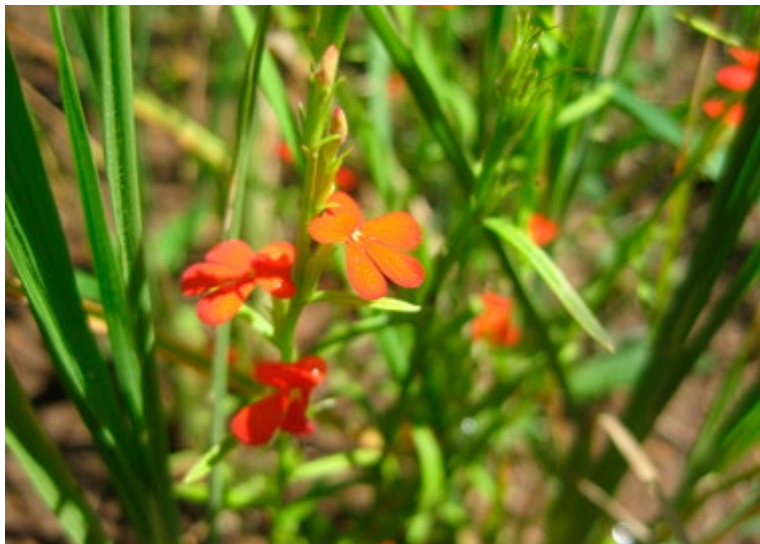
Striga asiatica , inheems in Azië en Afrika.

bovengronds opduikt, is het gewas vaak al verloren. De Engelse naam witchweed is veelzeggend.