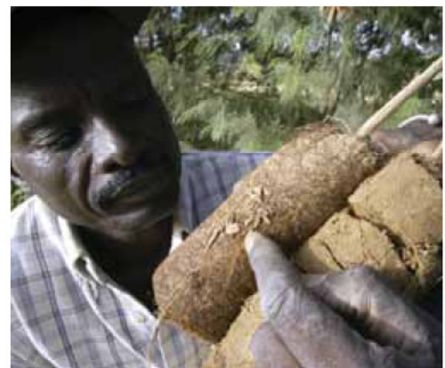
Aanplant van stikstofbindende gewassen in Senegal. Een boer bekijkt de stikstofbindende wortelknolletjes van de planten waaraan Rhizobium-bacteriën zijn toegevoegd.